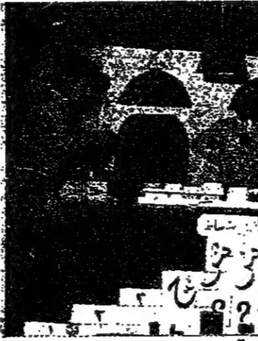
النشاطات الثقافية في و ج

وعمداً صندوقاً للاقتراحات ورسناً به فترة طويلة تزوف على المنتسبين ، نخرجنا بنتيجة ما يلي : ان الاقتراحات